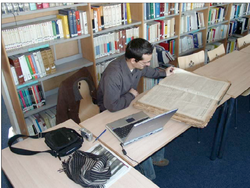
▲ Bibliothèque Jean Maitron, mars 2007.